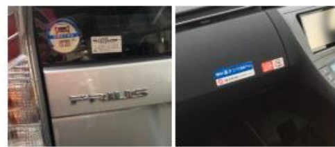
楽ノリレンタカーステッカー